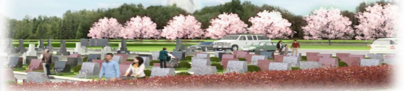
【墓地区画図】(全368区画)